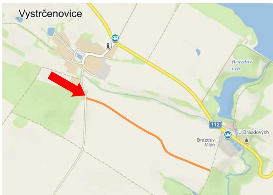
Obr. 1 – situační mapa.